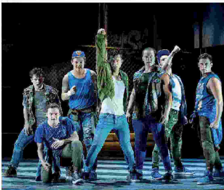
Due momenti di “West side story”

nuances orchestrali, al suo debutto a Cagliari. L'opera, della durata complessiva di 2 ore e 30 minuti circa compreso l'intervallo, viene, ovviamente, rappresentata in lingua originale inglese, ma, come ormai tradizione al Teatro Lirico di Cagliari, viene eseguita con l'ausilio dei sottotitoli in italiano che, scorrendo sull'arco scenico del boccascena, favoriscono la comprensione del libretto.