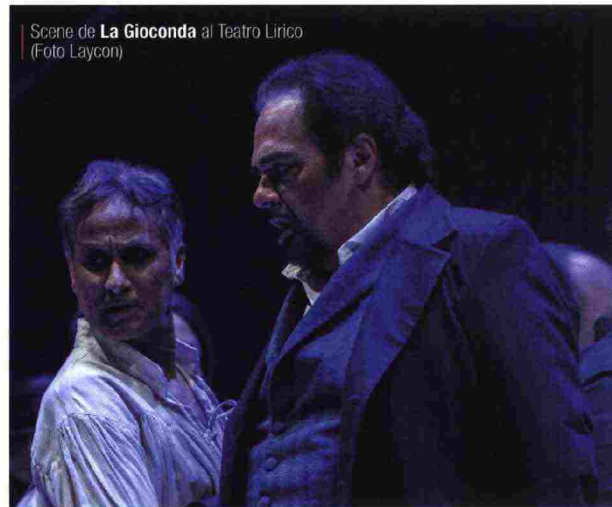
Scene de La Gioconda al Teatro Lirico