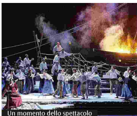
Un momento dello spettacolo

Il capolavoro di Ponchielli è in scena fino a oggi sul prestigioso palco e rappresenta il debutto, in città, per il regista Tonon. Sua la scelta di ambientare lo spettacolo nel 1876